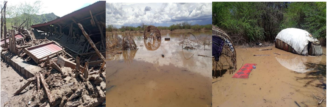
በሚያዚያ 2013 በሶማሌ ክልል በሸበሌ ዞን የደረሰ የጎርፍ ጉዳት